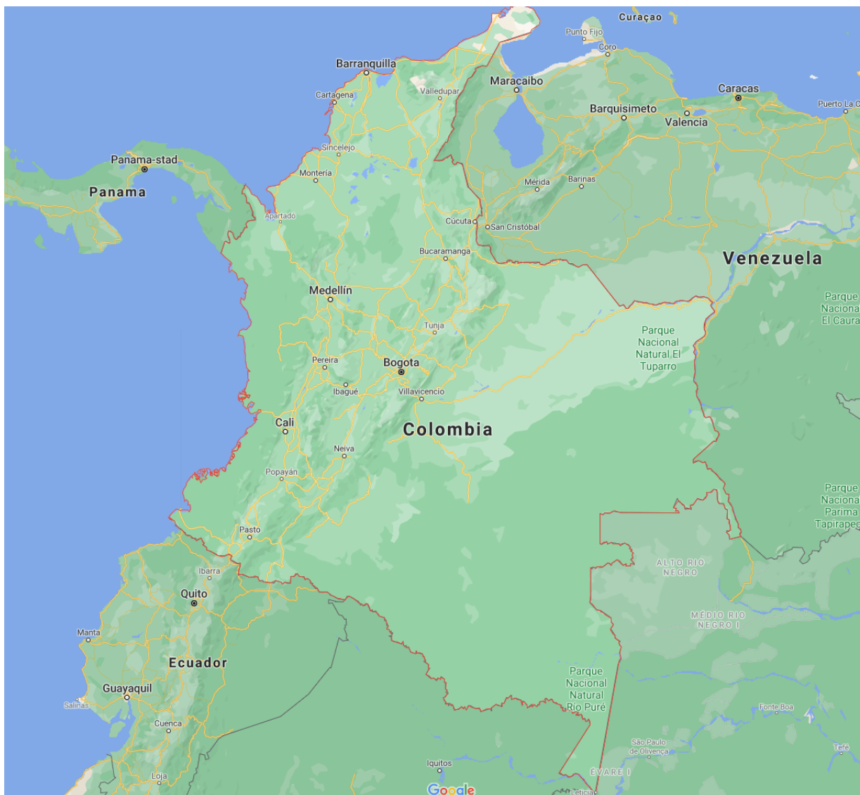
Colombia, 50 miljoen inwoners, tweemaal zo groot als Frankrijk.

Bovendien vallen de kinderen van de strijders van de gewapende groep buiten de ODR. Volgens een schatting van de VN-controlecommissie in haar rapport van maart 2020 zouden er nog ongeveer 2.200 minderjarigen zijn die zich in deze zorgwekkende toestand bevinden. Nochtans hebben de Colombiaanse overheden geen enkele uitleg gegeven over hun uitsluiting in het ODR-traject 19 .