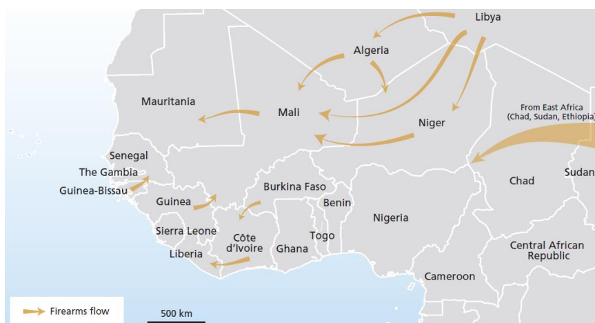
Les circuits du trafic d'armes en Afrique occidentale : le rôle de la Libye via le Niger et l'Algérie

Certains indices montrent une diffusion de ces armes depuis le Sud libyen, vers un périmètre élargi. Du matériel militaire provenant de Libye aurait ainsi été retrouvé dans pas moins de douze pays différents, dont plusieurs se trouvent en situation de guerre civile ou d'instabilité chronique comme la Somalie, la Syrie et l'Égypte 28 .