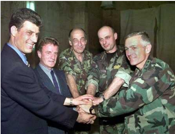
Priština, octobre 1999 : Hashim Thaçi, déjà Premier ministre, en compagnie de Bernard Kouchner, premier administrateur de la MINUK, du général Mike Jackson, premier commandant de la KFOR, d'Agim Çeku, chef militaire de l'UÇK, et de Wesley Clark, commandant suprême de l'OTAN.

Malgré sa « stratégie d'achèvement des travaux », le TPIY a encore la capacité de poursuivre ceux qui ont entravé des enquêtes, ce que semble avoir bien et bien fait la MINUK quand ces enquêtes touchaient des membres de l'UÇK. Carla Del Ponte s'est plainte, comme le procureur serbe, de dossiers déclarés d'abord inexistantes par la MINUK, avant qu'elle n'accepte de les transmettre au goutte-à-goutte. S'il en a réellement la volonté, le Tribunal pourrait également enquêter sur d'autres anciens responsables de la MINUK. En particulier, le zèle mis par Bernard Kouchner à nier toute possibilité de trafic d'organes et à dénigrer ceux qui évoquaient le sujet 18 pose des questions sur le rôle du premier chef de la MINUK dans cette affaire, d'autant plus que la période où il a exercé ses fonctions se confond avec celle où le plus grand nombre de disparitions s'est produit.