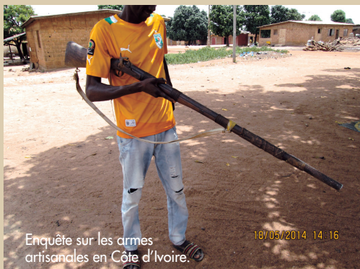
Enquête sur les armes artisanales en Côte d'Ivoire.