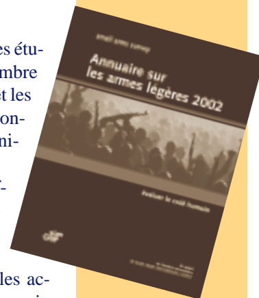
L'annuaire 2002, un ouvrage de 330 pages.