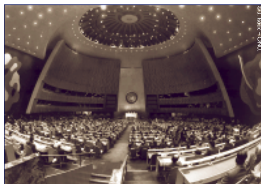
L'Assemblée générale des Nations unies : l'un des forums qui se préoccupe du trafic d'armes.

Trafics d'armes vers l'Afrique – Pleins feux sur les réseaux français et le « savoir-faire » belge, un ouvrage dirigé par Georges Berghezan, 192 pages.