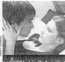
d'éthique en France.

Pourquoi les religions s'intéressent-elles tellement aux questions touchant à la sexualité?